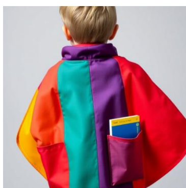
Sy magiske læsekapper!