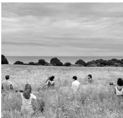
Lyden af lørdag med Ensemble Hermes: In Memoriam