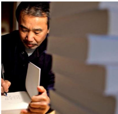
Murakami i ord, toner og billeder