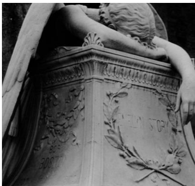
Lyt i mørket: Mozarts 'Requiem'

(Se særskilt program for vores lokale biblioteker)